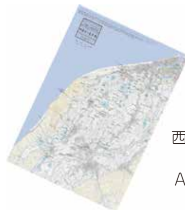
A2サイズ 西蒲原の治水マップ + A5特別小冊子付き